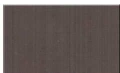
Wskaźnik pola magnetycznego

Odczyt wskaźnika odbywa się przy użyciu kliszy kontrolnej. Inkasent sprawdza jakość struktury domen magnetycznych przykładając kliszę do wskaźnika. W przypadku gdy struktura jest nienaruszona na kliszy kontrolnej pojawi się wzór złożony z kilku lub kilkunastu pasków o ciemnym zabarwieniu. Jeżeli na wskaźnik zadziałało silnym polem na kliszy kontrolnej widoczna będzie jasna plama. Kliszy można używać wielokrotnie, nie ulega ona zużyciu.